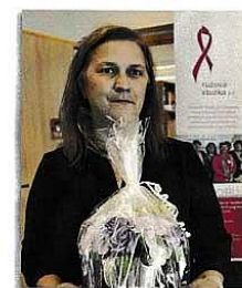
Erikine zázraky z myslia

Rodáčka z Krompáč. Už ako dieťa si rada kreslí a maľovala. V roku 2018, po dlhšej vyše 30 ročnej prestávke, skúsila znova maľovať, len tak, pre radosť. Jej obľúbené témy sú kone, domáci miláčikovia a nekonečne inšpiratívna príroda. www.facebook.com/maramalivakresby mdankova60@gmail.com