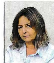
Len tak pre radosť

Rodáčka z Krompáča. Už ako dieťa si rada kreslila a maľovala. V roku 2018, po dlhšej výške 30 ročnej prestávky, skúsila znova maľovať, len tak, pre radosť. Jej obľúbené témy sú kône, domáci miláčikovia a nekonečne inšpiratívna príroda. www.facebook.com/maramalivaykresby mdankova60@gmail.com